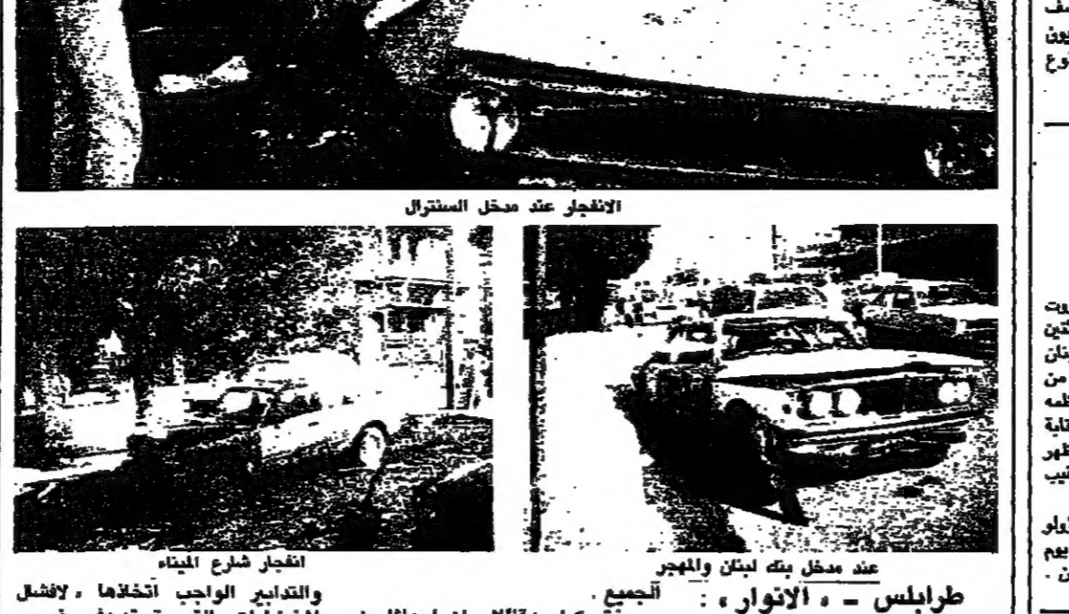
الانفجار عند مدخل السسترا